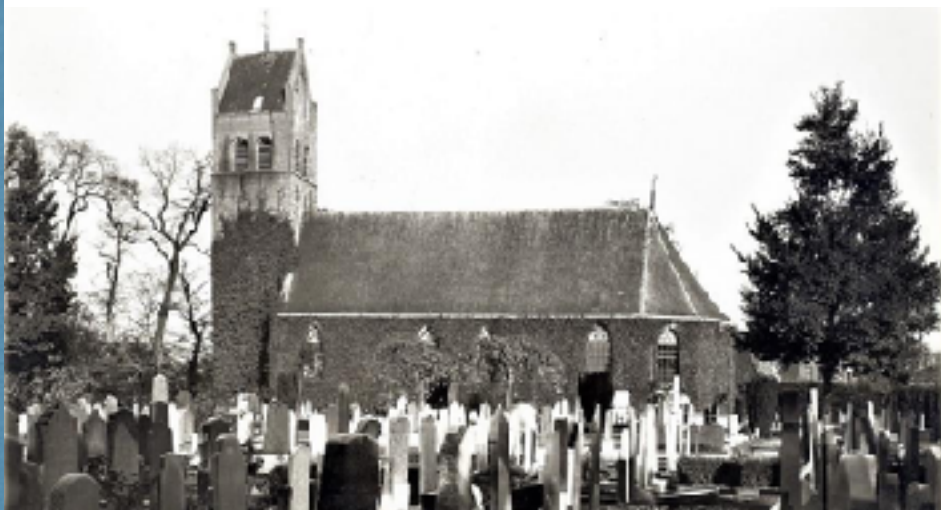
De Dorpskerk in 1940