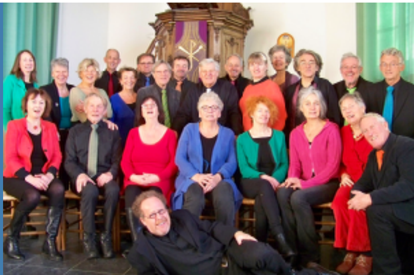
Kamerkoor Het Cantoor