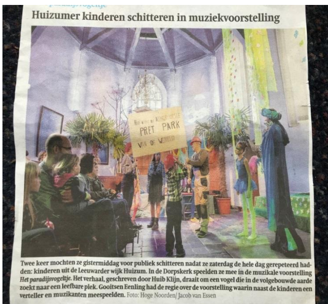
Recensie Friesch Dagblad