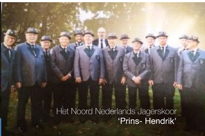
Het Noord Nederlands Jagerskoor 'Prins- Hendrik'