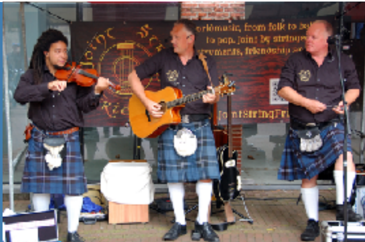
Joint String Friends