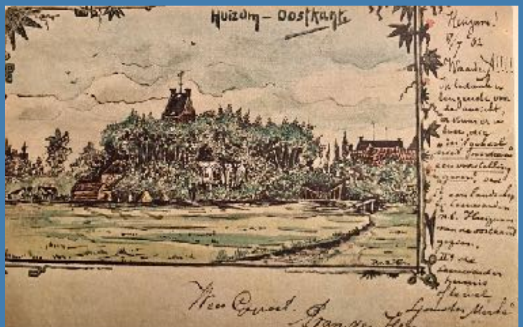
Aquarel Huizum Oostkant Piet van der Hem 17 juli 1902

Mooi is ook dat de gasten geld hebben toegezegd voor het onderhoud van hun familiegraven door de vrijwilligers van de Dorpskerk.